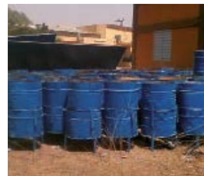
Bacs à poubelle à Dapélogo (Burkina Faso)