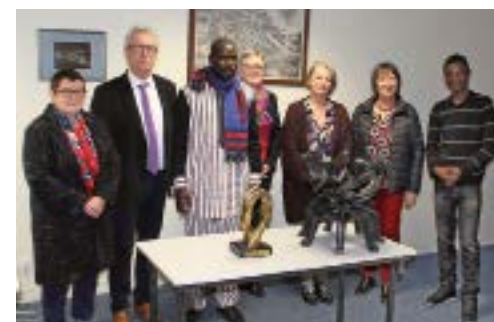
Accueil du Maire de Dapélogo à Loudun