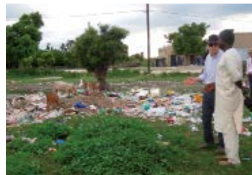
Déchets à Loul Sessène (Sénégal)