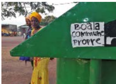
Poubelles avec message de sensibilisation à Boala (Burkina Faso)

Cette coopération internationale permet également à Calitom de sensibiliser le public charentais aux conséquences de la prolifération des sachets plastique au niveau planétaire.