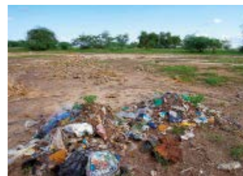
Communes Sénégalaises de Fimela et Djilasse : collecte des déchets avec Limoges Métropole