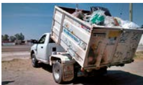
Benne à ordures à Silao (Mexique)

Un point de l'accord concernait « l'assistance technique à la mise en place d'un système intégré de collecte et de gestion des déchets ménagers » avec un diagnostic réalisé par un bureau d'études mexicain. L'étude couvrait l'ensemble de la Zone Métropolitaine de Léon, comprenant les municipalités de San Francisco del Rincon, Purissima del Rincon, Léon et Silao.