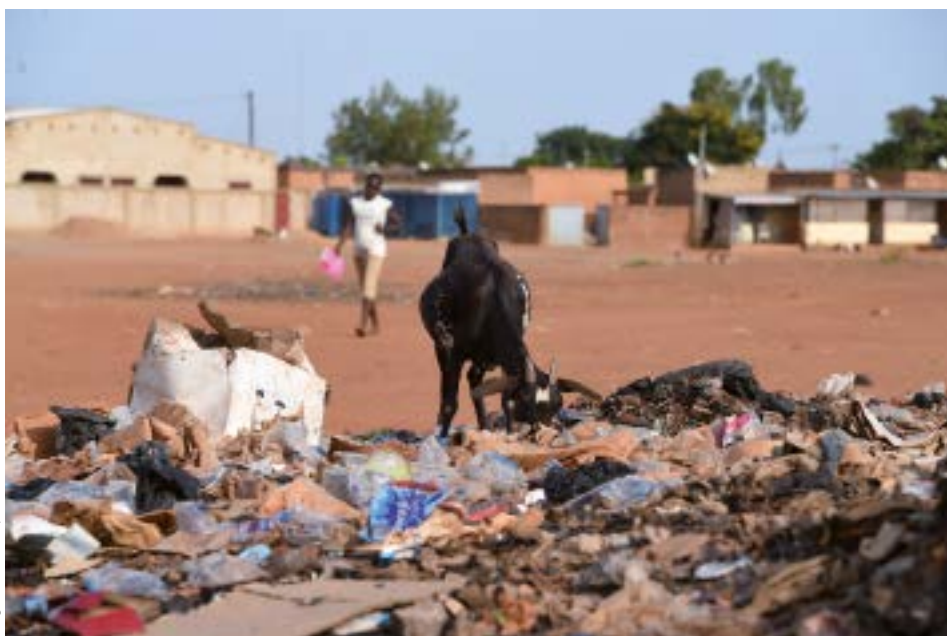
Dépôts de déchets à Ziniaré (Burkina Faso)

Plusieurs collectivités néo-aquitaines ont des partenariats avec des collectivités burkinabés sur la thématique des déchets: la ville de Châtelleraut, Evolis 23, Syded 87, la Région Nouvelle-Aquitaine, le Comité de jumelage de Chauvigny Coopération Banfora. Dans le cadre du « Groupe Nouvelle-Aquitaine Burkina Faso » créé en 2017 et animé par le réseau régional multi-acteurs de Nouvelle-Aquitaine « SO Coopération », les acteurs ont pu se rencontrer et un projet commun a émergé. Nommé PLASTIC (Projet de Lancement des Actions et de la Sensibilisation au Traitement Individuel et Collectif des déchets), il vise à renforcer la gestion communale des déchets dans 4 communes au Burkina Faso.