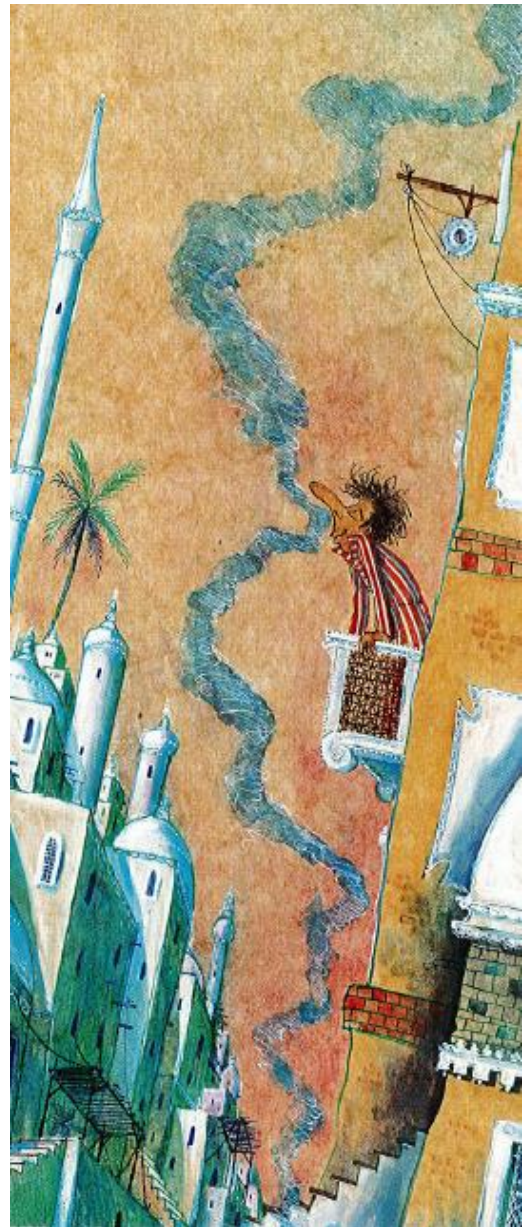
Sanji le voleur d'odeurs, Robin Tzannes, Korky Paul (1996) Editions Milan.

Avec l'atelier « L'étonnant univers des odeurs » les jeunes enfants pourront s'éveiller à l'odorat par un jeu de discrimination où les 4 autres sens brouillent les pistes.