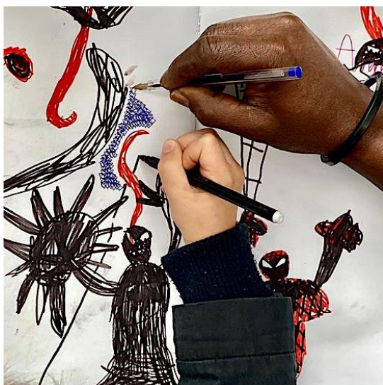
Deux mains @ Guy Lenoir, 2022

Studio photo éphémère spécial enfants et juniors par l'artiste Méga Mingiedi Tunga