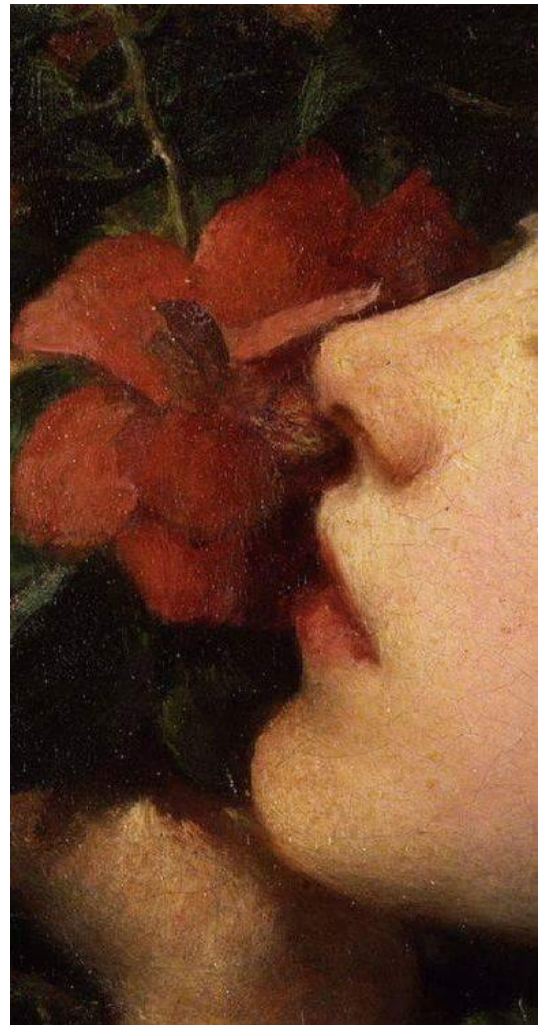
George Frederic Watts (1864) Dame Alice Ellen Terry 'Choosing'

Notre sens de l'olfaction une fois redécouvert, il pourra devenir notre allié, ami, protecteur et gardien de notre mémoire tout au long de notre vie. Pour peu qu'on en prenne soin. L'atelier « L'Odeur de la sagesse » est ainsi une parenthèse d'éveil et de sensibilisation pour apprendre à protéger et à développer notre odorat.