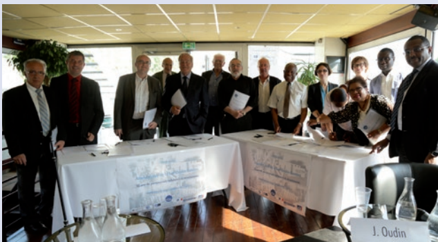
Signature d'élus de l'eau, 10 ans de la loi Oudin-Santini