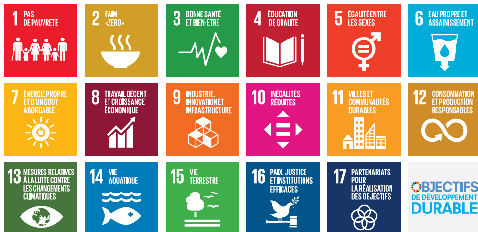
Les 17 Objectifs de Développement Durable