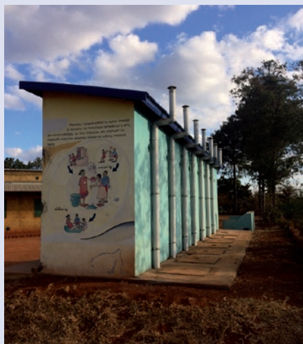
Bloc sanitaire, à Madagascar

► Évaluation d'environ 10 projets sur le terrain par an, financés au titre du Fonds Eau. Une mission de suivi-évaluation spécifique est conduite par un binôme d'instructeurs. Les autres missions de suivi-évaluation sont externalisées auprès du pS-Eau, organisme partenaire de la Métropole. Chaque mission de suivi-évaluation fait l'objet d'une restitution : un rapport de mission transmis au porteur de projet, aux instances de pilotage et aux autres cofinanceurs du projet; une présentation orale des enseignements issus de la mission terrain auprès du comité de pilotage et, si nécessaire, du porteur de projet.