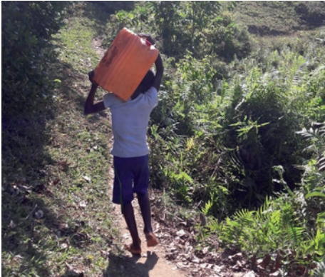
Corvée d'eau à Madagascar

En 2010, l'Assemblée générale des Nations unies et le Conseil des Droits de l'Homme ont reconnu « le droit à l'eau potable et à l'assainissement sûrs et propres » comme un droit humain essentiel.