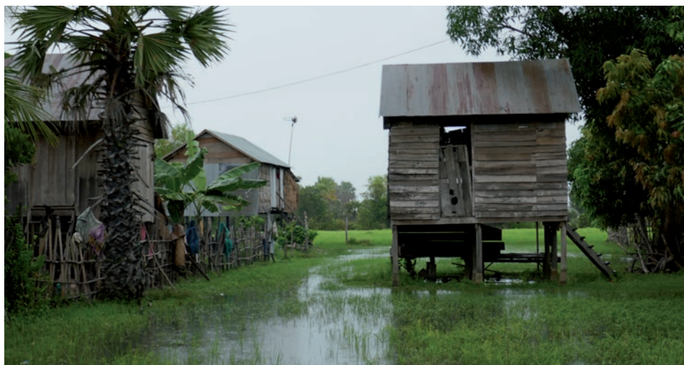
Parcelle inondée en période de mousson au Cambodge

Bien que les effets du changement climatique s'observent au niveau territorial, la lutte contre le réchauffement climatique et la mise en place d'actions d'adaptation dépendent en revanche nécessairement des coopérations internationales. En tant qu'actrices des territoires, les collectivités ont un rôle majeur à jouer dans ces dynamiques.