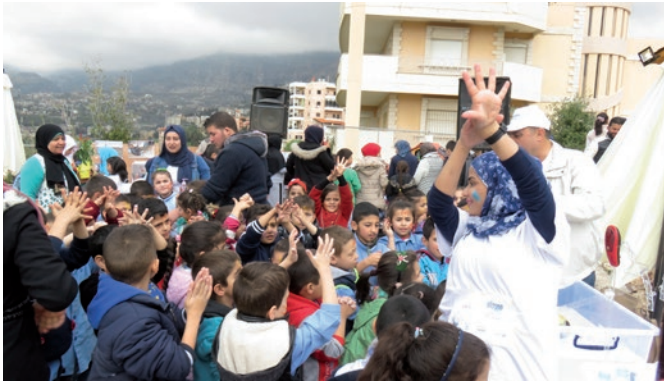
Sensibilisation au lavage des mains, au Liban

Pour définir le contenu d'un projet : voir les guides d'aide à la conception de projets du pS-Eau « Eau potable : 18 questions pour des services durables » et « Assainissement : 16 questions pour des services durables » (voir la Boîte à outils)