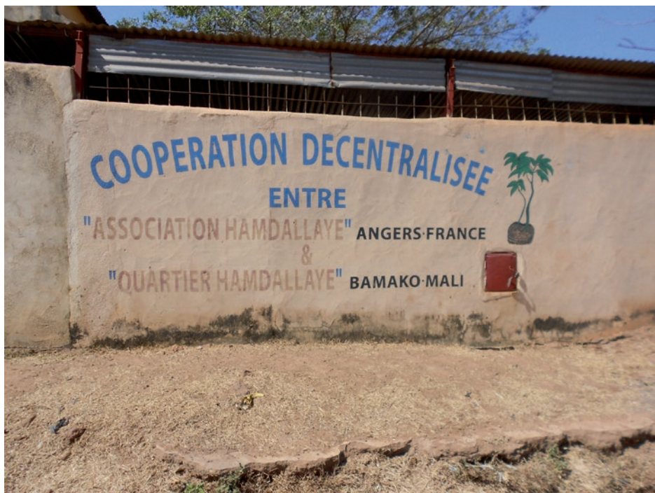
Dans le quartier Hamdallaye, à Bamako, Mali