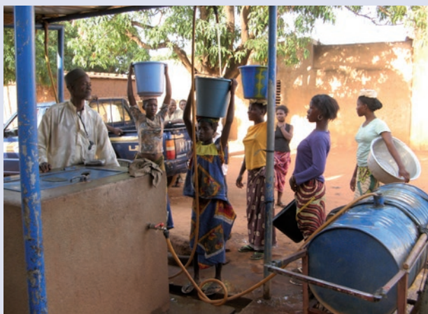
Corvée d'eau, Burkina Faso