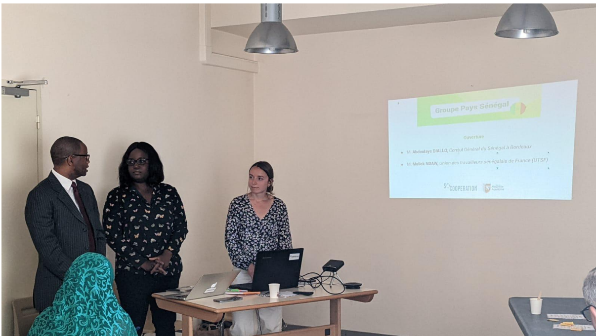
Introduction de M. Abdoulaye Diallo , Consul général du Sénégal à Bordeaux