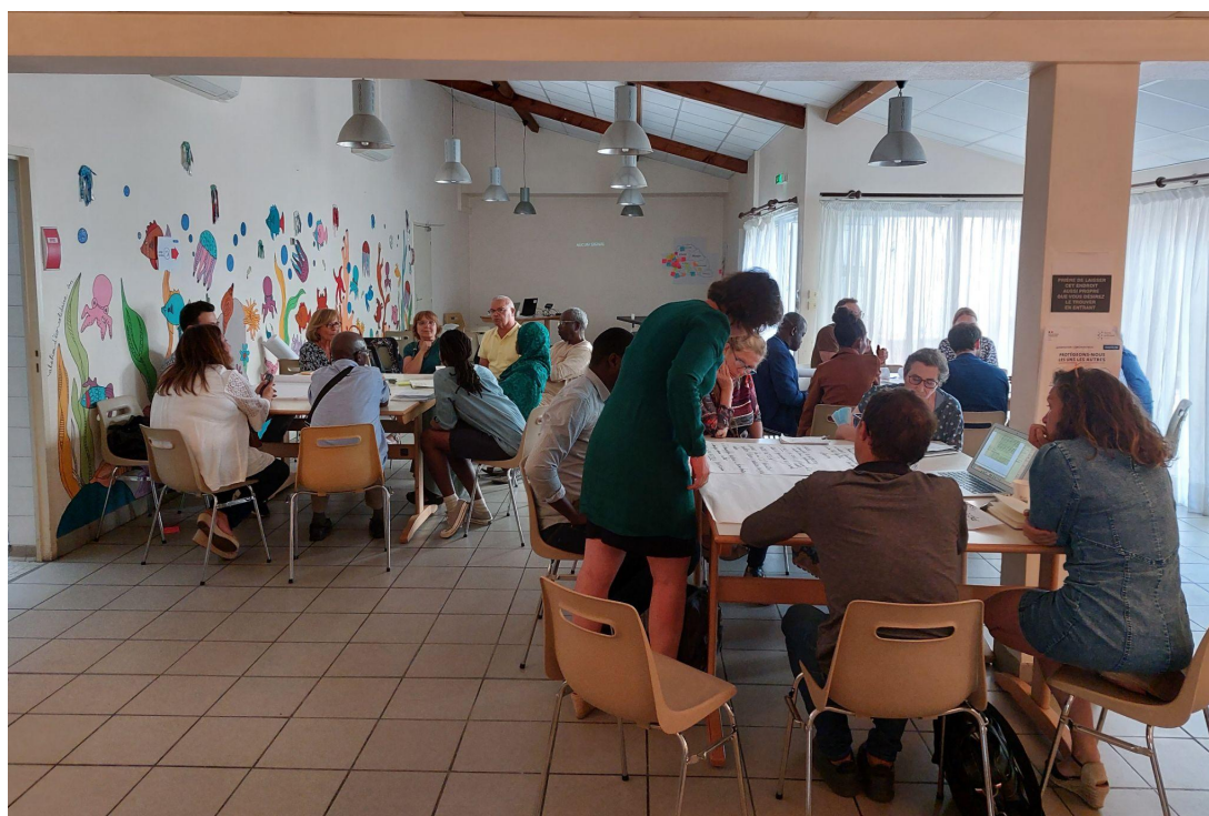
3 tables thématiques du World Café